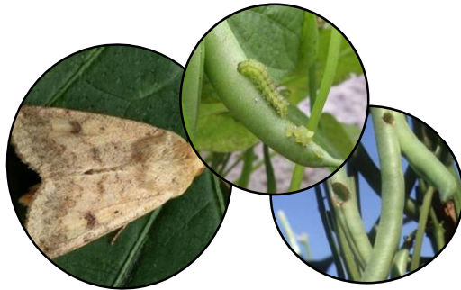
Mouches, Lépidoptères sur pois, haricots, nématodes sur cultures racinaires